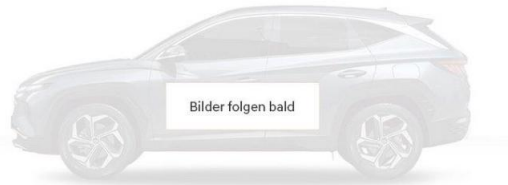
Abbildung ist als unverbindlich zu betrachten. Fahrzeugabbildungen enthalten z. T. aufpreispflichtige Sonderausstattungen.