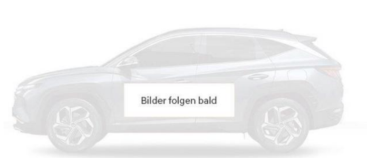
Abbildung ist als unverbindlich zu betrachten. Fahrzeugabbildungen enthalten z. T. aufpreispflichtige Sonderausstattungen.