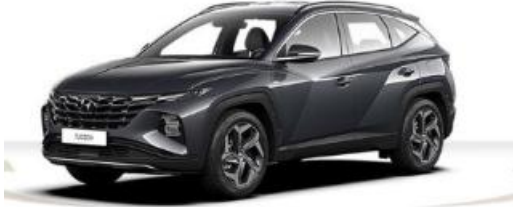
Abbildung ist als unverstärkt zu betrachten. Fahrzeugabbildungen enthalten z. T. aufpreispflichtige Sonderausstattungen.