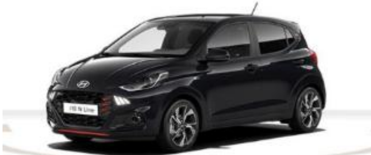
Abbildung ist als unverbindlich zu betrachten. Fahrzeugabbildungen enthalten z. T. aufpreispflichtige Sonderausstattungen.