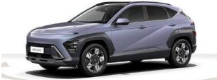
Abbildung ist als unverbindlich zu betrachten. Fahrzeugabbildungen entstehen z. T. auf berechneter Grundlage.