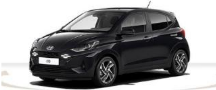
Abbildung ist als unverbindlich zu betrachten. Fahrzeugabbildungen enthalten z. T. autoreklamirte Sonderausstattungen.