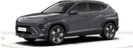
Abbildung ist als unverbindlich zu betrachten. Fahrzeugabbildungen entstehen z. T. auf Basispflichtige Sonderausstattungen.