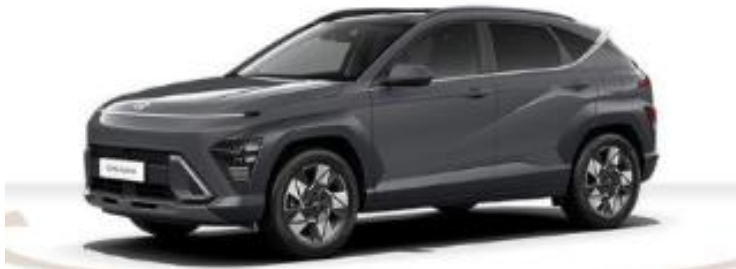
Abbildung ist als unverbindlich zu betrachten. Fahrzeugabbildungen entstehen z. T. auf preispflichtige Sonderausstattungen.