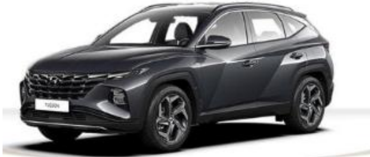
Abbildung ist als unverbindlich zu betrachten. Fahrzeugabbildungen enthalten z. T. aufpreispflichtige Sonderausstattungen.